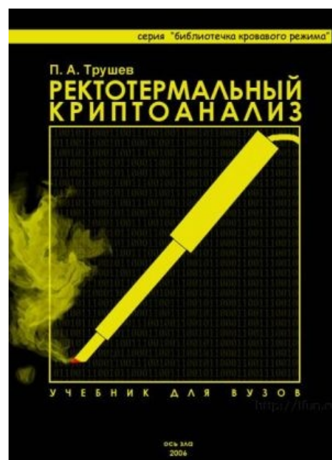
Мануал к терморектальному криптоанализатору.

Электрический вспоминатель Терморектальный криптоанализатор Сабж в народном творчестве Мопс. О паяльниках Бывший сиделец рассказывает о своём первом преступлении (с 3:19)