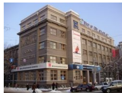
Центральный командный пункт ЁВТ в НН

Ёбаное ВТ — народное название компании «ВолгаТелеком» (она же ВоблаЦеликом, Во-бля, ВобляТелеком, ВолкаТелеком ), в 2011 году сгинувшей в пучине Ростелекома. Этот провайдер был в свое время практически единственным способом пофанать на проен выхода в эти ваши интернет ы в Приволжском федеральном округе. Емкий эпитет компания заслужила своей ценовой политикой, качеством услуг и отношением службы поддержки к ебонентам . Подобные «конкурентные преимущества» породили целую волну народного творчества. Посетители саратовских форумов ёбаного ВТ славятся своими хэйт-спичами во славу компании.