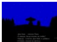
А почему бы и нет?