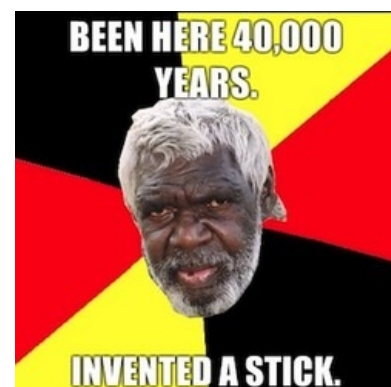
Были здесь 40 000 лет. Изобрели палку

«Я не считаю, что по отношению к аборигенам Австралии была совершена несправедливость — более мудрая, более чистая раса пришла и заняла их место. »