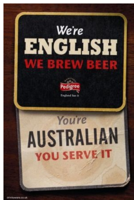
Отношение британцев к австралийцам

Чрезвычайно занятный исторический факт: помимо Первой и Второй Great Wars, Оззиленд вполне официально участвовал в The Great Emu War, сиречь Великой Войне со Страусами Эму. Нет, правда: одно