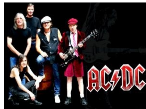
Классический состав и православное лого