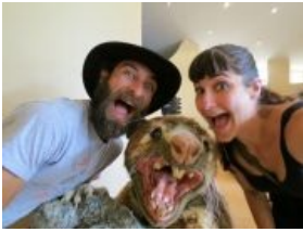
Фото счастливой австралийской семьи