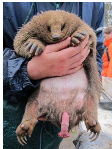
Колючий властелин хочет

Детёныш ехидны вначале лишён иголок, и мама таскает его во временной сумке на животе. Если ей дать валерьянки, мускулы, образующие сумку, расслабятся, и она пропадёт. Когда детёныш становится слишком крупным, мать оставляет его где-то в укромном месте. Защищаясь, он отпугивает врагов