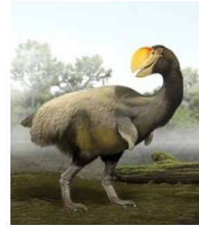
Утка смерти хочет, чтобы ты рассказал ей рецепт фуа-гра и гуся с яблоками