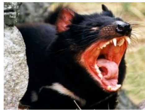
U MAD, LOL!

Ранее крупный вид сумчатых дьяволов обитал на материковой Австралии, но там просрал все полимеры, когда пришли динго. Тасманийский вид пока жив, но далеко не процветает. Виной всему рак, убивающий : среди зверей свирепствует болезнь, передаваемая через укусы и вызывающая появление опухолей. Недуг часто передаётся, когда охотчий до пиздытинки самец кусает самку за голову во время бурной случки. Для зверьков эта болезнь стала страшнее, чем ядерный пиздец, поскольку у них есть неиллюзорный шанс отправиться вслед за следующим героем статьи.