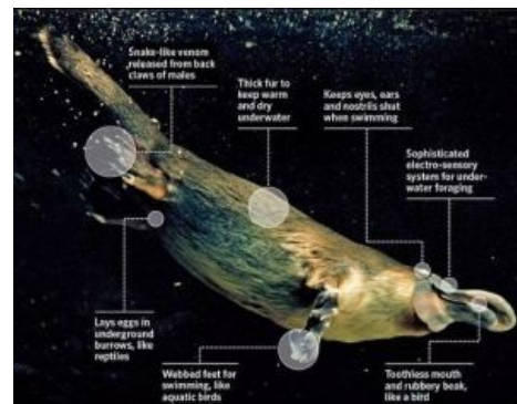
Ну разве не пусечка?

Алсо, когда появились динозавры, млекопитающие... повымирили. Нет, это не шутка: ранее считавшиеся ящерами так называемые «зверозубые ящеры», оказалось, мало чем отличались от яйцекладущих млекопитающих, по сути ими и являясь. Так что подобные зверушки — древнее самих динозавров и смогли их пережить.