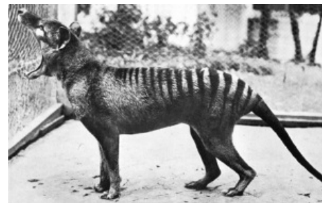
«Кто на новенького?»