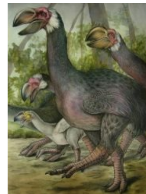
«Вместе весело шагать по просторам!»