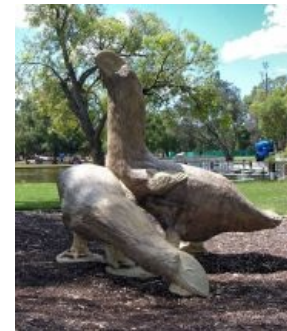
Пруд с утками по-озиевски