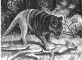
Ярри — полосатый призрак Квинсленда