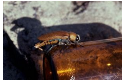
Жук особым образом прикладывается к бутылочке

Когда в Австралии появились стада овец и коров, животноводы столкнулись с проблемой: пастбища