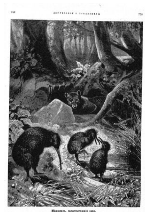
Гравюра из олдфажной книги о природе: мешкопёс из Австралии готовится напасть на киви из Новой Зеландии