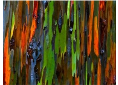
С вашими мозгами всё в порядке . Это — настоящая кора радужного эвкалипта