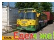
iichan.ru party van