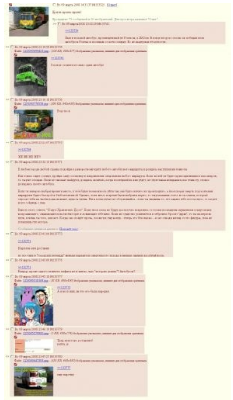
Скриншот из /b/, а не из /tr/, как может показаться на первый взгляд