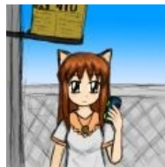
ЮВАО-тян ждет автобус