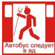
И еще одна