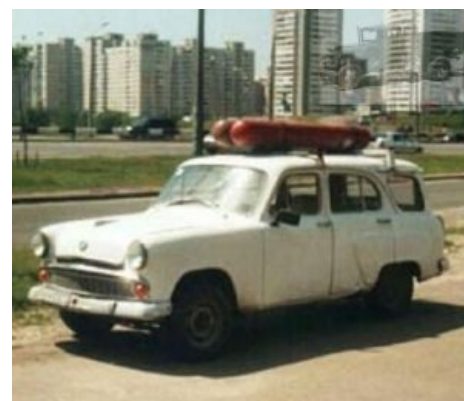
Поставь метан, сука

Первым современным гибридом был мелкосерийный Toyota Prius (1997) для Японии. В 2000-м для США выпустили Honda Insight, неоднозначной внешности авто, заставляющее срать кирпичами всех любителей стандартного быдлодизайна. Срачи: Хонда-гибрид против Тойоты-гибрида . У владельцев тойоты вызывает баттхёрт тот факт, что хонда скоммуниздила дизайн приуса, и этим они постоянно тыкают владельцев хонды. Владельцы хонды утверждают, что у них экономия выше, обзор лучше, на что тойотовцы кичатся нормальной динамикой и крутой анимационной заставкой на ЖК-мониторе при запуске двигателя. Приборная панель у приуса под лобовым стеклом, а у Инсайта панель классическая, даже есть тахометр, который, тем не менее, для гибрида не нужен . Насколько же нужен сам гибрид, покажет лишь время. Пока