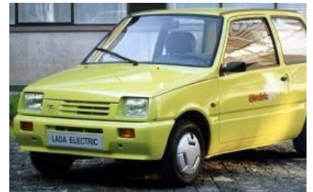
Ока на электроприводе...