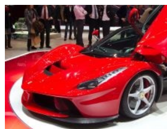
Внезапно, гибридный Феррари. Все в ахуе.

Профиль немца смотрит на сраных япошек как на говно.