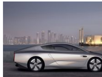
Профиль немца смотрит на сраных япошек как на говно.