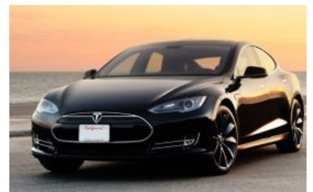
...и пафосный Tesla-S. Чуешь разницу, чуешь?