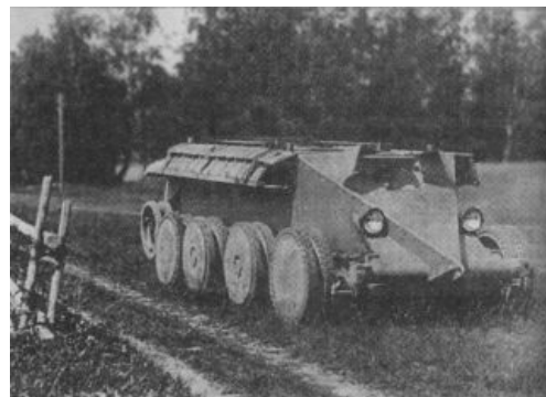
Агрессивный танк Кристи такой агрессивный!