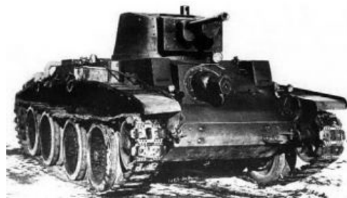
Польский 10ТР. Да, это именно от него Гитлер оборонялся в 39ом!