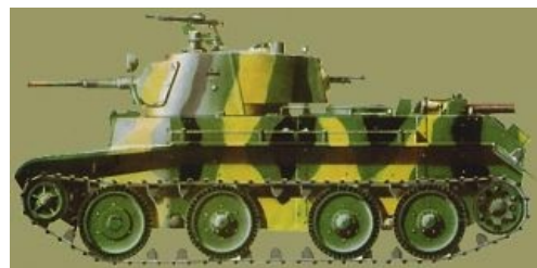
БТ-7, автострадная машина агрессии

случае войны орды БТшек должны были выйти на немецкие автобаны, сбросить гусеницы и на полной скорости двинуться на Берлин. Экспериментальный же А-20, по мнению Суворова, должен был быть ещё более грозной машиной, и буква «А» в индексе расшифровывалась не иначе как «автострадный».