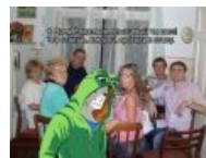
Сыч и пидорашки Травы с iHerb