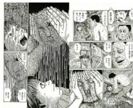
Довить! Причём обязательно на тян — они это любят