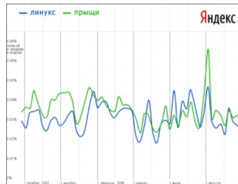
Линукс, прыщи, всё видно