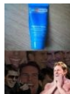
Том Круз знает толк в лечении