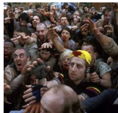
Зомби с АГП

Ну разумеется, преступление — не сбрасывать напалмовые бомбы на женщин, детей и стариков, а протестовать против этого. Преступно не уничтожение посевов — что обрекает миллионы на голодную смерть — а протест против этого. Не разрушение электростанций, лепрозориев , школ и плотин — а протест против этого. Не террор и пытки, применяемые «частями специального назначения» в Южном Вьетнаме — а протест против этого. Недемократичны не подавление свободного волеизъявления в Южном Вьетнаме, запрет газет, преследования буддистов — а протест против этого в «свободной» стране. Считается «дурным тоном» бросаться в политиков пудингом и творогом, а вовсе не принимать с официальным визитом тех политиков, по чьей вине стирают с лица земли целые деревни и бомбят города. Считается «дурным тоном» устраивать на вокзалах и уличных перекрестках дискуссии об угнетении вьетнамского народа, а вовсе не колонизировать целый народ под предлогом «борьбы с