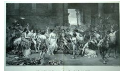
...а поутру и Вавилон посерел, и блэкджек скоммуниздили...