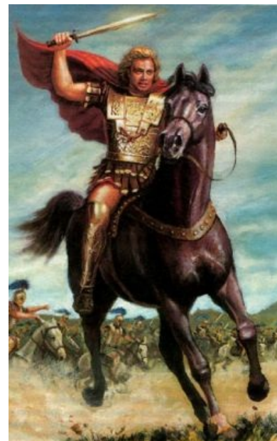
Александр III видит в тебе Дария III

«Филиппу я обязан тем, что живу, а Аристотелю тем, что живу достойно. »