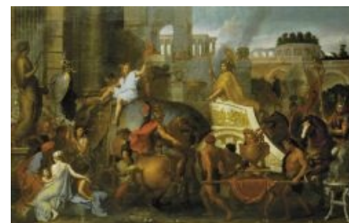
Александр вступает в Вавилон со своим блэкджеком и своими шлюхами...

Македонский сказал ему, что он-де козёл, Клит сказал то же самое. Генералы, чуя, чем это может