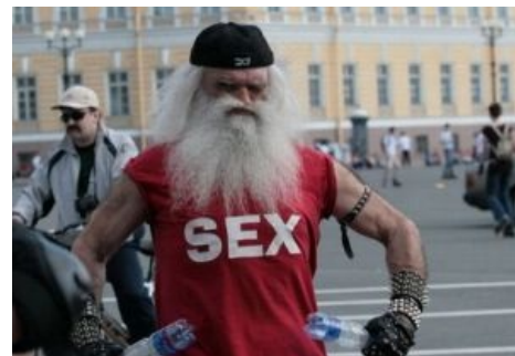
МС Вспышкин демонстрирует искусство Dual Wield

Существует связь между термином и практикой подготовки античных воинов, состоявшей в обязательном обучении владению оружием обеими руками. При недостаточной развитости доспеха, прикрывающего конечности, была велика вероятность повредить или полностью утратить вооруженную руку. Именно поэтому, по крайней мере, военной аристократии прививалась амбидекстрия .