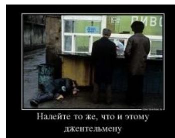
И в культурной столице