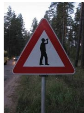
Латвийский (пруф) дорожный знак