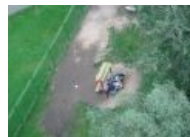
Алконавты Default City в отключке