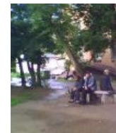
Совет. Кто же пойдёт за бутылкой?