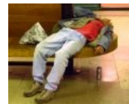
... притяженья больше нет! ©