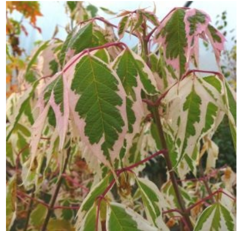
Враг умеет подать себя красиво. Сорт Flamingo.