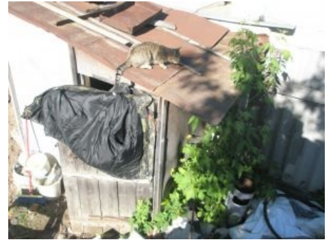
Оккупант в естественной среде обитания