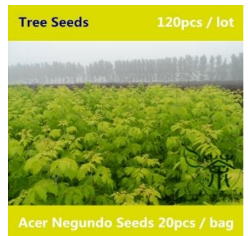
Если ты лох и олень, можешь купить его семена у китайцев. И им польза, и тебе наука.