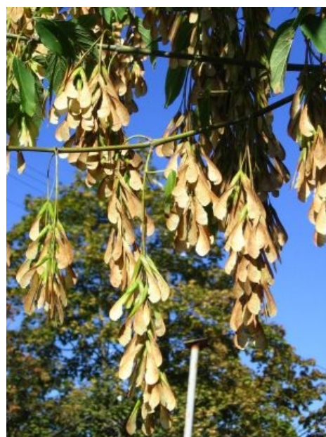
Семена сабжа — десантники-морпехи в биологической войне