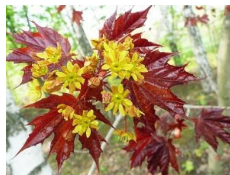
Клён остролистный сорта «Кримсон Кинг» зацветает. Эту форму листа вы знаете с детства.

В городах также часто высаживается клён приречный ( Acer ginnala ), семена которого похожи на семена клёна ясенелистного, но более красноватого оттенка. Также он представляет собой высокий кустарник и крайне редко растёт деревом. Его листья обычно трёхлопастные с более крупной средней лопастью, осенью краснеют. Этот вид практически не сорничает. Есть и другие виды клёнов, которые применяются в озеленении городов, особенно на юге.