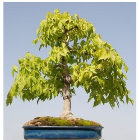
Из этого говна можно сделать вот такую конфетку: бонсай.