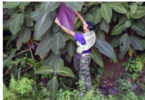
Микония в гостях на Таити.

В уязвимых к внешним воздействиям островных экосистемах любое чужеземное растение, особенно закалённый в борьбе за существование вид материкового происхождения, автоматически становится сорняком. Так что на Гавайских островах любые завезённые деревья представляют собой нечто вроде героя этой статьи по отношению к местной флоре.