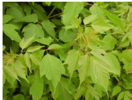
Ты точно его видел