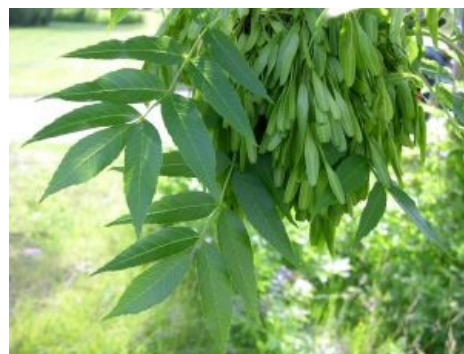
Вместо тысячи слов: это ясень.

В отличие от клёна, ясень ( Fraxinus excelsior ) — это твой бро, желанный и приятный гость в твоём городе и лично у тебя во дворе. Но ботанические знания большинства школьников, увы, далеки от желаемых, поэтому, наточив топор войны против американского захватчика, следует чётко зазубрить его отличия от ясеня, чтобы вместо зловредного врага не завалить случайно своего зелёного друга. А посему стоит обговорить поподробнее, чем отличаются друг от друга эти два дерева.