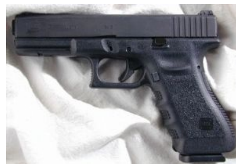
Glock 17. Суровый, нордический