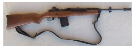
Ruger Mini 14, орудие труда норвежского агрария

В своем дневнике Брейвик писал, что 18 июня «все могло сорваться», так как хозяйка склада, в котором он прятал взрывчатые вещества, захотела прийти в это помещение за своими вещами. Но Брейвик сумел