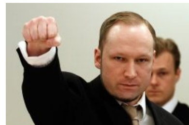
Андерс как бы приветствует тебя