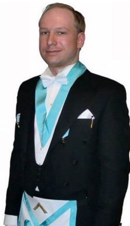
Казалось бы, при чем тут жыдомасоны ?

Стоит отметить, что либерастии среди масонов подвержены преимущественно представители так называемого «нерегулярного масонства» (regular — обычный/традиционный, а не «регулярный», в этом контексте; irregular здесь переводится по аналогии), к числу которого относится знаменитая «ВВФ» , ещё в 19-ом столетии отменившая необходимость для новообращённых уверовать в Б-га и заморачиваться по прочему мракобесию, а с XX века давшая добро участвовать в своих собраниях женщинам. В то же время так называемое «регулярное масонство», несмотря на все слухи, чаще всего при внешней аполитичности держится консервативных убеждений в политике, более того, содержит в своих рядах немалое количество самых отъявленных поциентов с диагнозом «ХГМ» и даже «ПГМ». Насколько известно, Андерс Брейвик принадлежал как раз таки к одной из лож регулярного масонства.