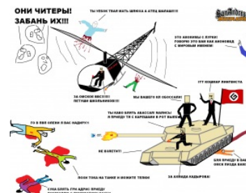
Креатив об Омской Армии в SAMP

https://www.youtube.com/v=Vmqx0MABElk Всем плакать два часа Гонник Дрончик: ГАРЖУСЬ РАСЕЙ (Эксперимент) Один из провалившихся проектов