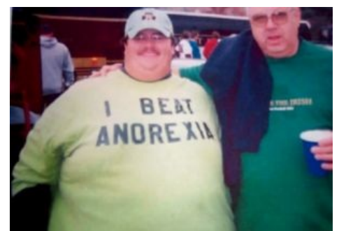
Толстым троллям насрать на анорексию.