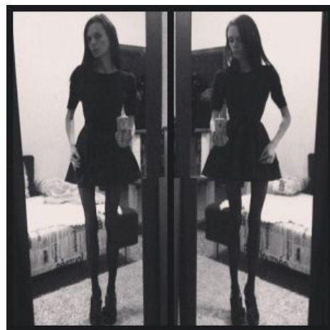
Make me unsee it.

«— У анорексичек нет мозга, ибо он сожран на обед изголодавшимся желудком.