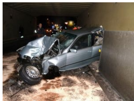
Апстена — природное место обитания бумеров

«Сперва было брюхачество — художник шел и выставлял свой живот, лакированный и с разными штуковинами, которые держались на пластыре или вживлялись, но и это приелось публике; поэтому на вернисаже стали оставлять голую бетонную стену, а художник, обильно полив себя фиксауаром, брал хороший разбег и головой в стену, чтобы так уже и остаться — натюрмортом в суицидальном стиле. »