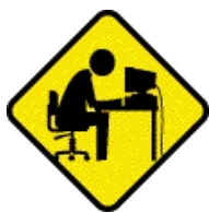
Убейся о клавиатуру.