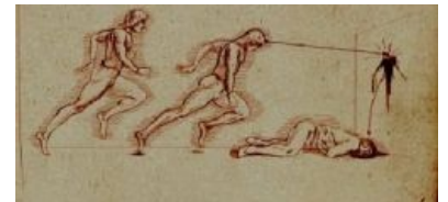
Иллюстрация, автор: Леонардо да Винчи