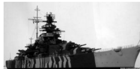
Ферзь — «Тирпиц» в прикиде лета 42-го года

Ещё весной шибко умный адмирал Редер предложил хитрый план под названием «Ход конём» (нем. « Rösselsprung »), по итогам которого немцы должны были помножить на ноль минимум один конвой. В основу плана был положен прокачанный немцами скилл — «орднунг». Благодаря чёткому взаимодействию и жёсткому подчинению всех имеющихся сил одному начальнику планировалось взять островитян за жабры, измордовать постоянными разносторонними набиганиями небольшими группами юнитов, постепенно расхуячить все силы прикрытия и добить кораблики с ништяками подлодками и авиацией.