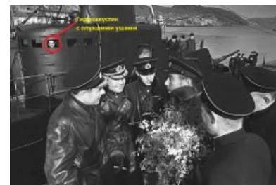
Торжественная встреча К-19

Уинстон Рандольфович высрал нехилую кучу кирпичей по данному поводу, вплоть до мысли: «А может, ну их нахуй, эти конвой?», но Коба пресёк на корню такие поползновения и пораженческие настроения, разведя его на «Будь мужиком, блеать!» . Рэндольфович напыжился, но согласился зарядить в этом сезоне ещё один конвой, как договаривались.