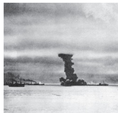
— Азербайджан! — Ранил!