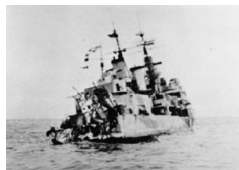
«Эдинбург» с повреждениями зада кормы и дырочкой в левом боку