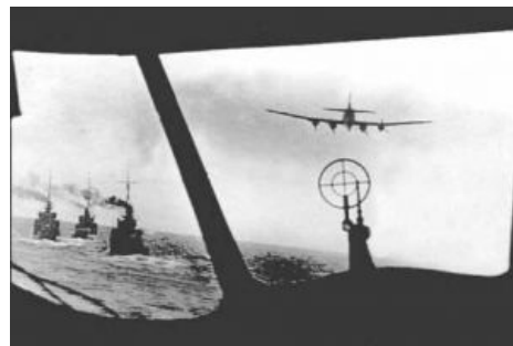
«Кондор» над конвоем [2] .