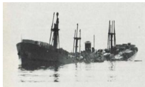
Хрусть и пополам. Эмблема PQ-17 [3]