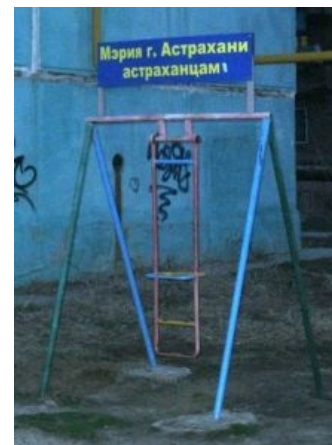
Щедрая мерия такая щедрая

Ввиду удалённости от Default City деньги до Астрахани, мягко говоря, не доходят. Потому в 2008 году на полукруглой дате было решено провести типично астраханское празднование юбилея города, принесшее кучу бабосов местному правительству. Характерным символом юбилея стал ансамбль из статуй на