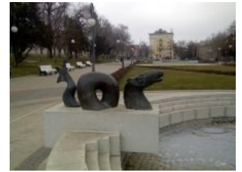
Композиция «Лохнесское чудовище нападает на плывущую лошадь»

праздников, фестивалей и прочих поводов жажнуть ее родимой , нет ни одной урны, поэтому горожанам от безысходности приходится «бить соплей» в производное высоких душевных воспарений скульпторов из города на Неве.