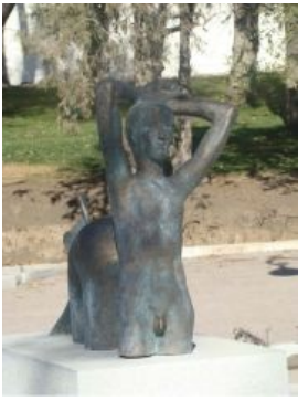
Подарок на юбилей — статуя «Мечта педофила»

центральной площади работы питерских архитекторов, очевидно, с непривычки переборщивших с местным ганджубасом. Особенным успехом пользуются памятник левитирующей тётке, Зелёное муженщино и «Мечта педофила» в лучших традициях ЦарьЭтелли и прочих мозго-ахтунгов.