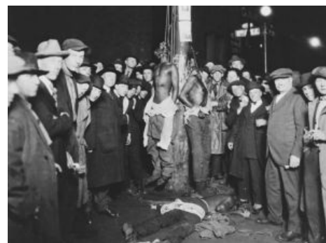
Суд Линча как он есть. Казалось бы...

Но устойчивым оно стало после Гражданской Войны Севера и Юга США , так как на находившемся в кризисе Юге страны (а на Севере, на словах и деле боровшимся с рабством — даже чаще) начались трения между бывшими рабами-неграми и бывшими рабовладельцами-белыми (и прочими « прогрессивными » белыми — такие дела). Как итог, за одно только подозрение в совершении деяния, негр мог быть подвергнут той самой православной процедуре.