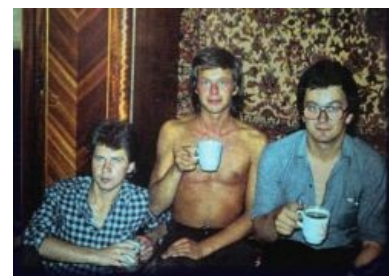
БГ и его ковёр

Мальчики тоже собирали «бобовнички», однако же старались этого не афишировать. Всплывало главным образом в случае, когда мальчик решался расстаться с одним из экспонатов своей коллекции для