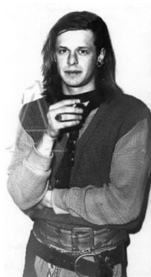
Шликабельный Боренька такой шликабельный