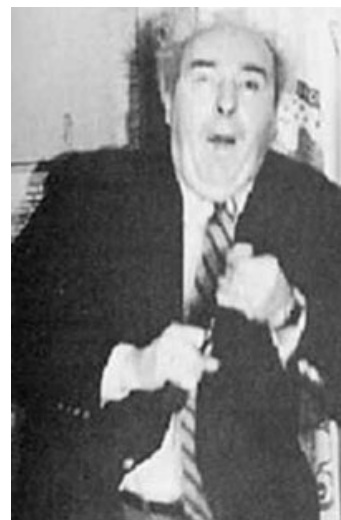
I did it for the lulz