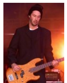
ВНЕЗАПНО Киану тоже басист

Сферический басист в вакууме выполняет весьма незаметную на первый взгляд функцию, а именно придает движение ритму. Роль его инструмента, а говорим мы здесь о бас-гитаре, можно описать так: если наваять простой ритм из удара бочки на первый счет и удара ведущего барабана на второй, то в принципе из этого ритма можно еще сделать что угодно — хоть рок, хоть панк, фанк, хеви-метал, хип-хоп, Р'н'Б, джаз и даже хаус. Когда к этому ритму добавляется бас — скелет ритма и его стилистика становятся понятными и на него можно уже наращивать мясо из партий других инструментов. В принципе бас может быть заменен клавишными, духовыми, и вообще многими инструментами, играющими в нижнем ( басовом ) регистре, но делается это очень редко