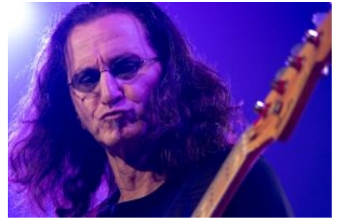
Типичное лицо басиста на сцене

Спор о том, чем же следует играть на басу, пальцами или медиатором, является пожалуй одним из самых драматичных и доставляющих холиваров не только среди самих басистов, но и в музыке вообще. В целом считается, что медиатором играть не ТРУЬ . Об этом знает практически любой музыкант, даже если он играет на треугольнике и бас никогда в руках не держал. Использующие медиатор басисты порой подвергаются порицанию, довлению а иногда даже травле со стороны окружающих.