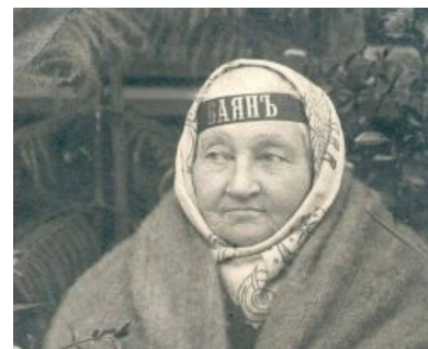
Бабушка Русской революции как бы намекает

Есть еще такая: в домино — очень популярной среди советского рабочего класса настольной игре — баяном называлась костяшка 6/6 (шесть/шесть). Любая доминошка с одинаковыми числами на обеих половинках (1/1, 2/2 и т. д.) называлась «дубль», а «баян» был самым запоминающимся из них, имеющим к