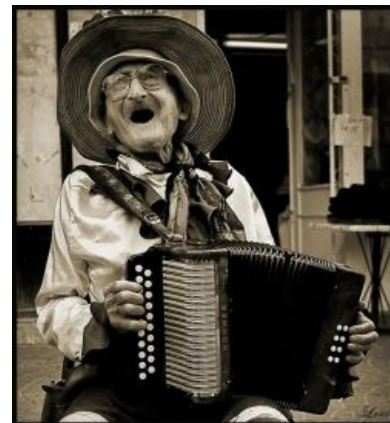
Снесла курочка дедушке...