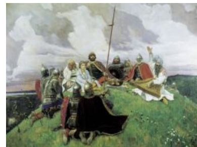
Боян в изображении художника Васнецова (1910), справа отчетливо виден facepalm

Боян сам по себе возник задолго до интернетов, в частности это хорошо продемонстрировано на картине Васнецова « Витязи слушают Бояна », где отчётливо различим православный форум и витязи, его участники, с пиететом и в то же время чувством собственного достоинства внимлющие Бояну, который, как оказывается, вовсе не на гармошке выражал свои бородатые затрёпаные шутки и прочие банальности, а на современном для той поры струнном инструменте — гусях (бета-версия балалайки). Творил он лет за 150 до событий «Слова о полку Игореве», в связи с чем неудивительно, что для автора «Слова» песни сказителя были замшелыми баянами (о чём он повествует в первых строках).