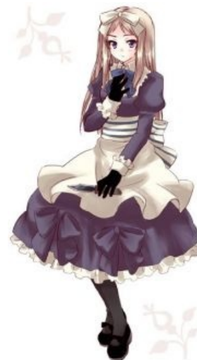
Наталья Арловская — персонификация Беларуси в Хеталии . Отношения с Россией и Литвой доставляют.

Когда инфляция уже начала превышать африканские показатели, пришло время начальству разобраться как следует и наказать кого попало . И что ви таки думаете — чуть позже состоялось внеочередное Батино откровение придворным таблоидам, на котором Лукашенко густо вбросил говна на вентилятор, обвинив народ в скупке валюты, сахара, спичек, машин, холодильников, блядей, в распиздяйстве на работе, алсо напомнив о мерзких планах гнилого запада и кровавой гэбни на лакомый кусок ака Беларусь. То есть в который раз всплывает прыдурковатая сущность поциэнта и маниакальная боязнь уражэских агентау в духе Холодной войны. Особо доставляют обвинения рашкинских СМИ в угнетании нерезидента нагнетании обстановки в стране , если вспомнить приверженность луканавтов советским принципам цензуры. В общем, соснули все, кроме главного .