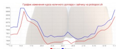
Очертания графика вполне узнаваемы...

Наступила осень и вместе с ней очередное эканамическая чуда. Скакнули квартплаты, в два раза выросли цены на жратву и прочие товары народного потребления (в очередной раз), которые, кстати, куда-то резко стали исчезать (в Гомеле, например, внезапно из магазинов испарились мясо, полуфабрикаты, торты, хлебобулочные (кроме самого хлеба), ну и прочие никому не нужные ништяки), а белка снова ёбнулась вниз и теперь один унылый енот стоит почти 8700 белок! Казалось бы, куда уж хуже, но то ли ещё будет... 13 октября 2011 на неофициальном всебелорусском обменнике prokopovi.ch был замечен график обмена, отражающий полный стабилизец местной валюты.