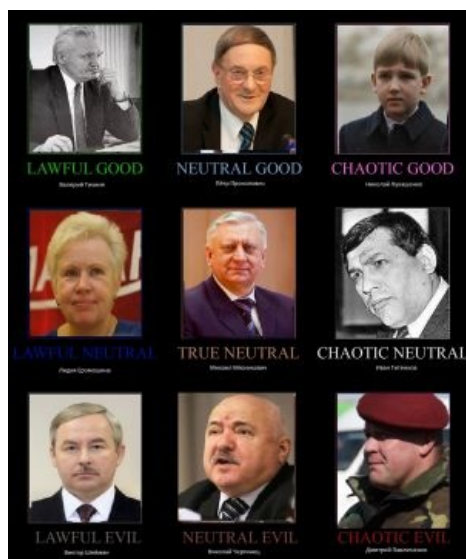
Команда Бацьки altogether