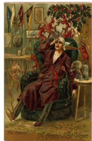
Выглядит это примерно так