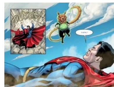
Приходит даже к супергероям

Если же грань ты уже переступил... Важно, что фиксация пациента необходима, даже если он кажется мирным, ибо содержание глюков может смениться в любой момент. Сейчас белочки лежат в реанимации зафиксированными : в хую у них трубка под названием катетер — и дуркуй сколько влезет.