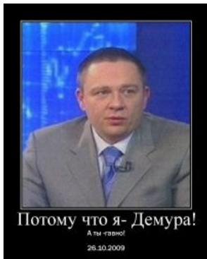
Мотиватор с Демурой.

Он же оналитег, анал. Непосредственного отношения к торгам на рынках не имеет, по причине того что уже все проебал, но зарабатывает тем, что помогает другим спускать деньги в унитаз. Очень любит вещать на канале РБК. Так же, как и брокер питается исключительно молодыми и неопытными трейдерами, подбрасывая им бесплатные советы, от которых опытный трейдер убежал бы как от огня. Аналы якобы предсказывают движение цен, но большинство не только оказываются неправы, но ещё любят интерпретировать новостной поток крайне неверно. Зачастую пишут в своих анал-итических справках очевидные вещи, что доставляет немало лулзов! Любой уважающий себя аналитик должен иметь в своем репертуаре 2 оправдания на неверно данные прогнозы: — это то, что в цену бумаги уже заложены ожидания рынка и в обратном случае, что рынок будет испытывать корреляцию в связи с вышедшей статистикой.