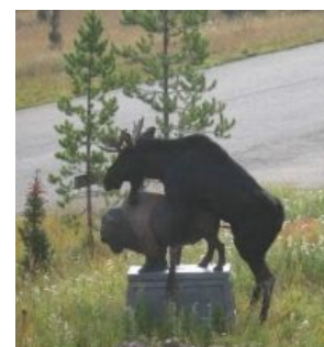
Лось ебёт быка, пример из дикой природы

У трендов есть весьма впечатляющие точки, а именно: Йух и Йах. Но вот незадача, видно их только из будущего (а вы думали — в сказку попали?). Поэтому многие молодые биржевые дочеры спрашивают профессииОНалов: «Йух или Йах?» На что профессииОНалы дают чёткий ответ: ХЗ.