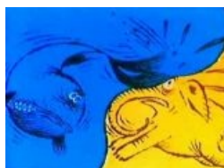
Из того самого мультфильма