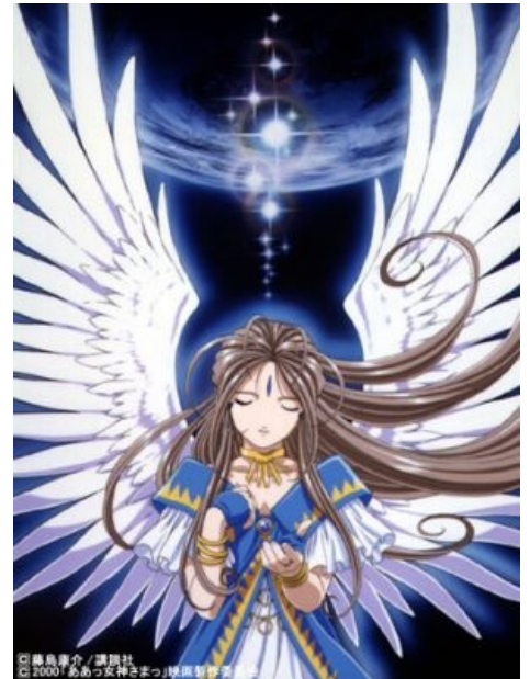
Сферическая японская скандинавская богиня в вакууме.