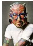
Французский дьявол Этьен Дюмон