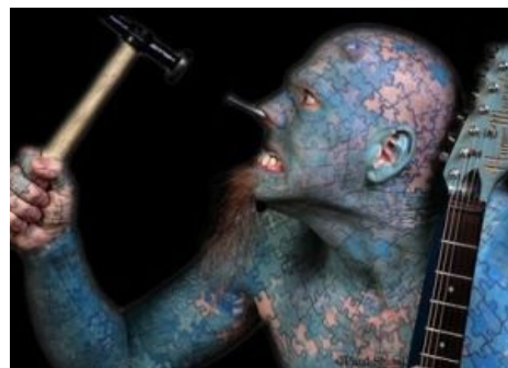
Гвозди бы делать из этих людей