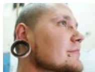
Я крутой бодмодер!