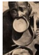
Красота — страшная сила