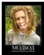
Русский бодмод как он есть

производства, выпендрёжников терпят — исключительно ради создания видимости большого числа участников движения.