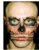
Рик Джэнест. Человек-Смерть.