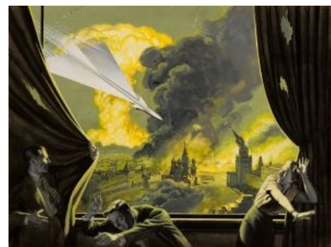
«Взаимное гарантированное уничтожение»™, как его видели в 60-х