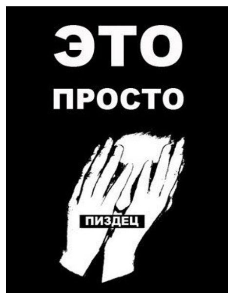
Это просто пиздец