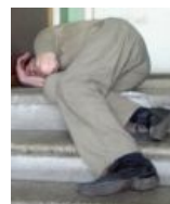
Нет бомжи на кораблю. Позвольте — Ваш порог слезами окроплю!