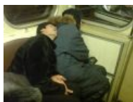
И ыццо так