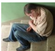
Мама, роди меня обратно.