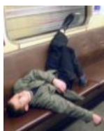
...А мне — в Медведки!