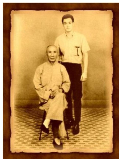
Каноничное фото с учителем

Ну а вообще, даже по словам самого "великого пиздюлятора", ему самому часто попадало. По два раза за день. Ибо был задирист несоразмерно своей силе. Поводом к сече мог послужить простой взгляд, который крив и несуразен — по-крайней мере, как казалось самому Ли. Вплоть до того, что кто-то не так вздохнул, не должным образом извинился или раскаялся в содеянном, когда наступил на ногу. Особо якобы страдали английские юнцы, кои были избиваемы им с особым рвением, поминая добрым словом надписи «Собакам и китайцам вход воспрещён» во времена Опиумных войн . Как итог — ходил вечно аки драный кот , что вынудило папаню выделить денег, которые он детишкам из принципа не давал, на уроки кунг-фу. Засияла надежда на успокоение юного буреветника.