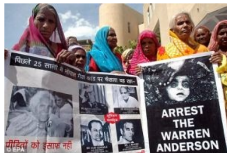
Индийских Людей Обижают!