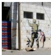
In Soviet Russia... Бэнкси намекает