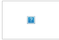
Грустный Бен в хайрезе