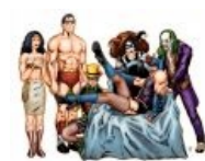
Бэтмен косплеит легендарный трешак