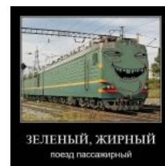
Зелёный, жирный, поезд пассажирный

Без ВЛ85 не обошлось и взятие 100К на Бчане . Сообщение № 100020 содержало мотиватор с фотографией двух локомотивов под номерами 100 и 20; к цифрам «100» была подписана буква « k », что явно означало намерение автора взять 100К. Хотя это и не получилось, но совпадение номера второго локомотива и последних цифр номера сообщения позволило считать его 100020-гетом, одним из двух незафэйленных в 100К-суматохе гетов (100К + 20 = 100000 + 20 = 100020).