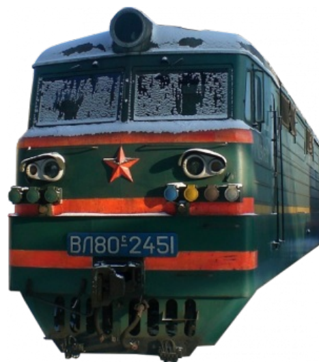
Предшественник сабжа. Алсо, exploitable