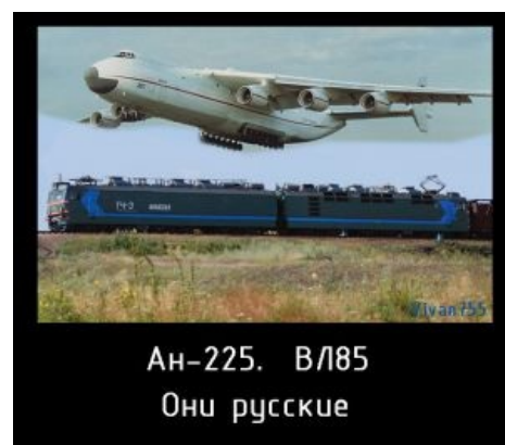
Славянские корни, укрмотив