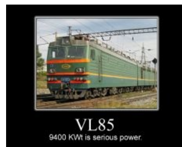
Длинный и зелёный

Две группы из четырёх разноцветных выпуклостей на морде — это розетки (жоксы на жаргоне) для подключения дополнительных секций для работы по СМЕ , при которой можно управлять из одной кабины не двумя, а сразу тремя или четырьмя секциями, образующими локомотив ещё более монструозной мощности. (По сходному принципу, кстати, можно объединять компьютерные видеокарты в SLI или CrossFire). Строго говоря, СМЕ используется и в обычном режиме для двух секций.