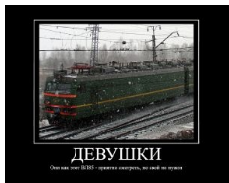
ВЛ85 кагбэ намекает: тян не нужны