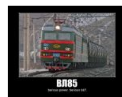
500К гет Двача