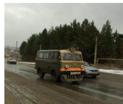
Автозавод имени ВЛ-85