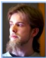
Ему 20 и он бородат