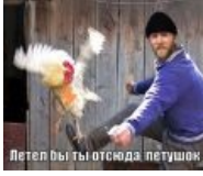
Петух — не человек