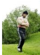
И опять Варг!