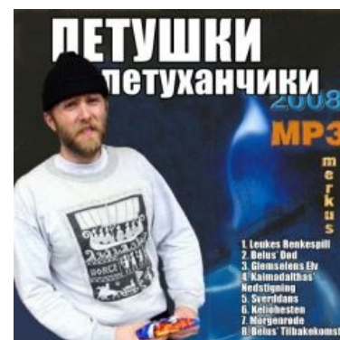
Народный вариант обложки.