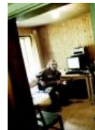
Тсс! Варг сочиняет