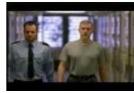
Ведут меня сквозь коридоры...