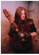
Варг, собственной персоной