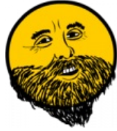
И даже кулфейс!