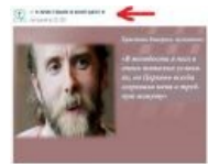
Тонкий подъёб несведущих