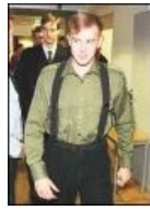
Варг в период активной Ъ- позиции.