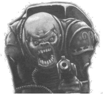
Довольный и радостный гибриды ген-стилера.

полноценные ген-стилеры (горбатые, хвостатые, четырёхрукие и с клешнями, способными вскрыть силовые доспехи космопеха, как яйцо от киндер-сюрприза). Однако, цель генокрадов — сохранять инкогнито до самого вторжения тиранидского роя и, главное, звать этот самый рой на «кухню». Тот самый «первый» генокрад (если, конечно, выжил), со временем вырастает, толстеет и умнеет, становясь лидером культа — так называемым «патриархом» ( Broodlord , он же Patriarch ) — обзаведётся усиленной костяной броней и когтями, режущими алмазными на счет «раз». Если умер, то «патриархируется» самый старый из новых генокрадов. Также, в силу развитого мозга, обладает mindcontrol'ными способностями. Культисты генокрадов засветились в настолке в качестве одной из сторон в игре Deathwatch Overkill , а совсем недавно даже заиграли себе полноценный кодекс.