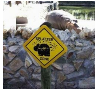
Наброс в природных условиях зоопарка.