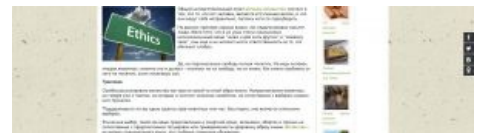
Типичная подмена понятий