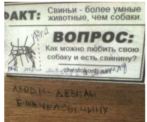
Веганская пропаганда и ответ анонимуса.