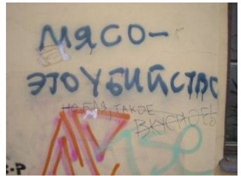
К. О. сообщает.

Еда их именно что поганая, а не другая . Так же как идиот - это идиот, а не альтернативно умный, мясоед - это поедатель