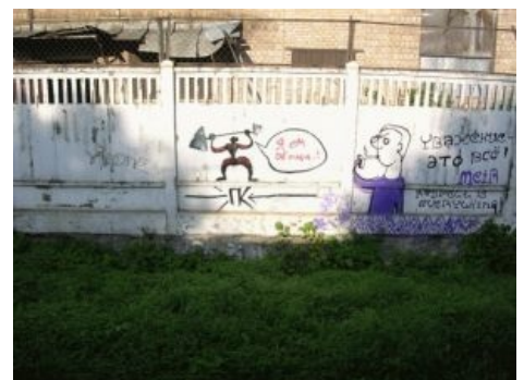
Веганы сильны в искусстве (потому что едят овощи ).