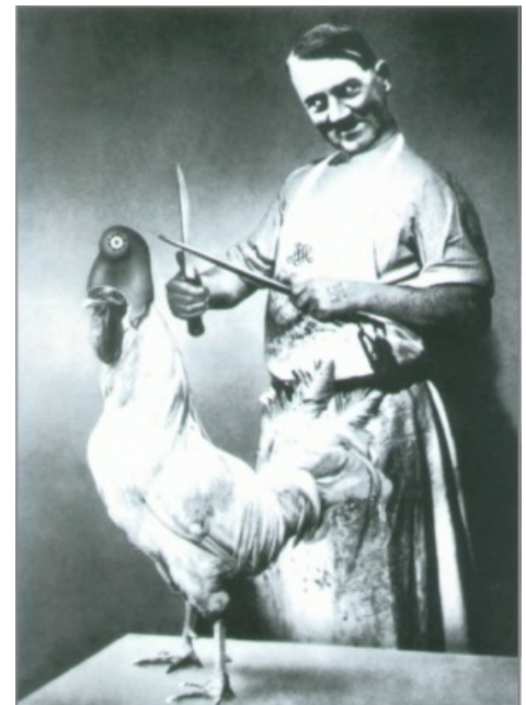
Не бойся, он веган.

Известно, что большинство веганов знакомы с биологией на примитивном уровне . И если формальное разделение животных и растений оставим на совести их желудков, то разделение в царстве животных остаётся загадкой. Хомячков и свинок они-то защищают, хотя комаров летом нещадно истребляют. По одной из версий, такой непонятный раздел биологически единого царства определён воплями, издаваемыми животными при гибели или кавайностью живности: пушистенького енота с табличкой «его жизнь важнее шубы» жалко, а комара вроде как не очень. Впрочем, такой шовинизм по отношению к животным свойственен скорее неофитам. Продвинутые веганы и за комаров страдают . По другому мнению из-за того, что мелкота из-за своего крошечного моска неспособна прочувствовать всю боль и ужас страданий. Отмазка мазанная, ибо межглазный ганглий рыбы воспринимает боль примерно так же, что и комариный.