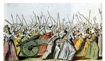
Женщины за революцию!

Чтобы силой заставить Людовика XVI санкционировать декреты и Декларацию, 5 октября того же года состоялся поход бедноты на Версаль к резиденции короля, состоявший в основном из женщин, а также солдат и