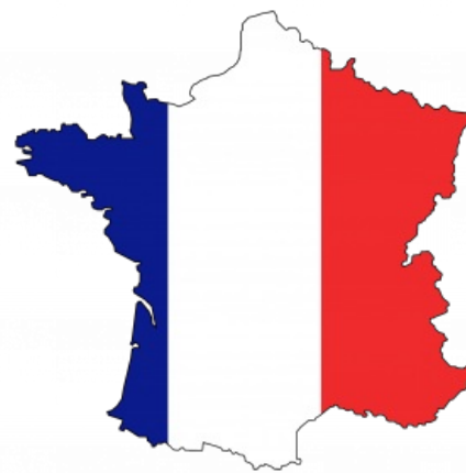
Le drapeau français

Так и появился тот самый сине-бело-красный вертикальный триколор, который развевается над Францией уже два с лишним века (с промежутком в период Реставрации, когда флагом было белое знамя Бурбонов; алсо, последний Бурбон — граф Шамбор, имевший все шансы стать королём Франции в 1873 году, был послан нахуй именно из-за нежелания признать национальным флагом трехцвет). Кроме того, стандарт французского триколора (основной принцип которого — самый светлый цвет должен быть посередине) лёг в основу флагов множества стран — от Бельгии и Италии до всяких там Чадов, Гвинеи и прочих банановых республик, бывших в своё время колониями Франции. А, например, флаг Гаити — первой в истории колонии, добившейся независимости, был сделан по принципу «вырезать белое». В прямом смысле — вместе с населением .