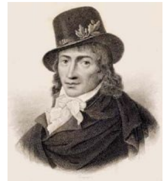
Камиль Демулен: Aux armes, ня!

Так как якобинцам при разработке какого-нибудь закона всё время мешали жирондисты, якобинцы бесились, но терпели. Но когда открылось, что генералы из Жиронды, командовавшие войсками (война, кстати, в течение ещё 20 лет так и не закончится) подкуплены иностранными агентами и специально проигрывают сражение за сражением, якобинцы плюнули на напрасную демагогию в Конvente и организовали (стук барабанов!!!) Революционный Комитет! Вначале он работал только против жирондистов, но это только в начале.