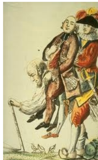
У Жака-простака широкая спина, всё вынесет...

12 июля 1789 года Париж узнал о том, что их любимого министра Неккера, с которым связывали надежды на выход Франции из тяжелого социально-экономического и политического кризиса , попросили