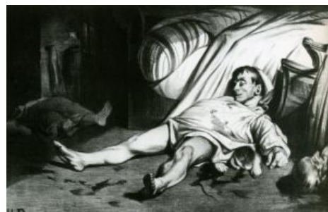
Гуро на улице Транснонен. Апрель 1834