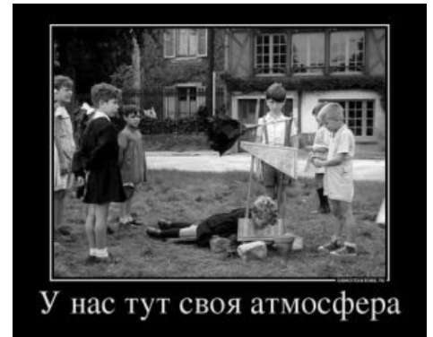
Испытание детского образца гильотины

С наступлением новых времен, как все думали тогда, требовались совершенно радикальные реформы. В том числе был отменен такой