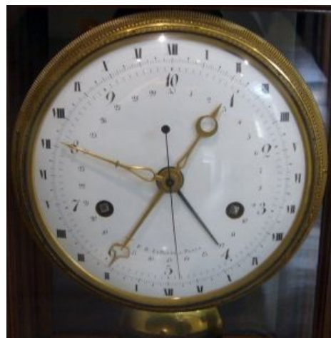
Образец часиков с революционным десятичным циферблатом.

А вскоре к власти пришёл один маленький человек , и автократия была восстановлена. Много хорошего сделал этот парень за свое правление: спас Францию от полного разгрома Европой (Итальянский и Швейцарский походы Суворова, например), устранил