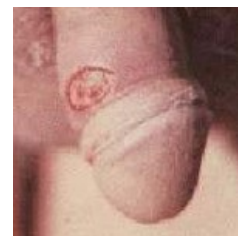
Тот самый шанкр