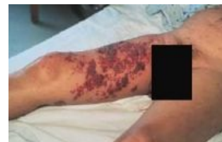
Симпятага генитальный герпес

Страшный, неизлечимый вирус. Достаточно 1 раз поймать, и всю жизнь по телу, в месте проникновения вируса в организм (МПХ, анус, половые губы, рот, глотка, язык, любые участки слизистой оболочки) будут с разной (индивидуальной) степенью регулярности появляться высыпания в виде язвочек, которые жутко чешутся. Также болят мышцы и повышается температура тушки. У многих вообще болезнь протекает бессимптомно (атипичный герпес) и они так до самой смерти и не в курсе, что таскают в себе такой ужасный вирус. Но это не значит, что они не заражают окружающих!