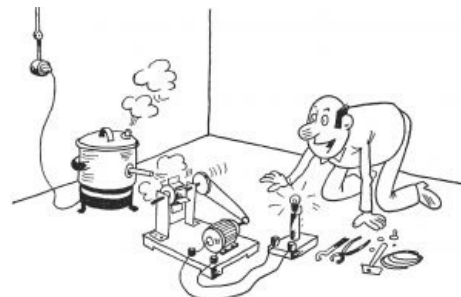
Карикатура из журнала «Изобретатель и рационализатор»

Если вы — физик, химик, биолог или просто слишком хорошо помните школьную программу соответствующего курса, вам лучше ее не читать. В противном случае вы рискуете умереть от смеха. Мы предупредили.