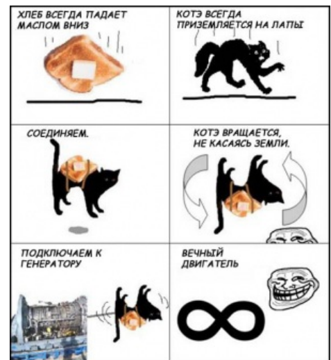
Всё гениальное просто.

Flying Horse - Gatorrada (Cat-Toast) Заработало же!