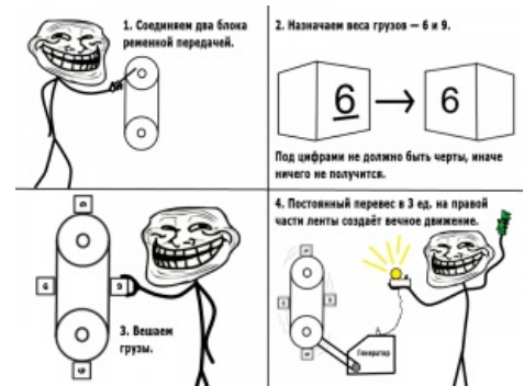
...и его инновационная модификация.