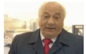
Колесо любит Путина.