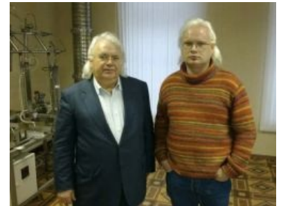
Петрик и злой брат-близнец