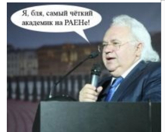
Факадеемик идёт к успеху

Посещение академиками РАН резиденции В.И. Петрика; ч.1