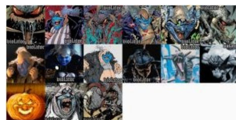
Арт «Петрик-Осквернитель» by

Незаурядность Петрика отмечалась еще в молодости. В то смутное время Витя еще не занимался коммерцией. В 1960-х годах уехал в Ленинград и поступил в военную академию, где и проявились его способности в гипнотической области . В результате старшине пришлось сменить рядового Петрика на уборке туалетов (уже тогда он умел промывать мозги), после чего Витю отправили обучаться в другой университет. Диплом по методике внушения в парапсихологии стал, по мнению специалистов , настоящей докторской диссертацией. Ещё обучаясь на курсе психологии, Виктор Иванович Петрик параллельно проходил в Ленинградском государственном университете курс физики. Который, как можно