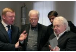
Грызлов строит хитрый план.