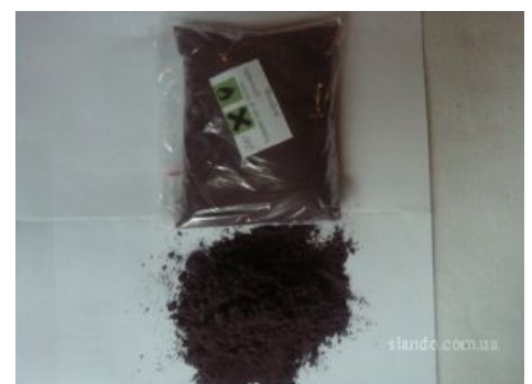
Красный фосфор собственной персоной

Раньше в качестве подобного лекарства использовали микстуру для астматиков «солутан», который в начале 2000 г. сняли с производства, но находчивые торчки тут не растерялись и стали выбивать эфедрин из разных других лекарств, таких как «Теофедрин», «Бронхолитин», «Гриппекс» и прочих эфосодержащих препаратов.