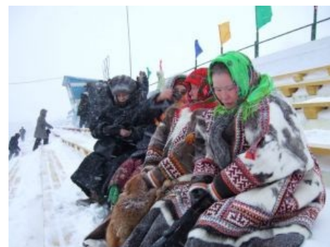
Ненецкие локогерлз. Основу составляют лютые слоупоки : зимой в футбол не играют даже в Воркуте

В окрестностях Воркуты невозбранно проживают настоящие аборигены — ненцы, суть единорасцы чукчей . За последние пару тысяч лет их образ жизни и промысла не претерпел существенных изменений, кроме того, что теперь они дичайше котируют чад кутежа , в связи с чем люто, бешено употребляют водку и никотин. После этого они разгуливают по городу с дробовиками, переговариваясь друг с другом по новоприобретенным сотовым телефонам . Для совершения товарно-сырьевого обмена расовые оленеводы приезжают на своих санях прямо в город, расставляя свои чумы прямо на площадях и улицах и окружая их заслоном из олений . Раньше они тупо обменивали оленину и рыбу на водку, но взвешенная социальная политика российского правительства вывела правосознание коренных народов на принципиально новый уровень. Теперь они сначала продают оленину и рыбу за деньги, а уже потом цивилизованно обменивают все эти деньги на водку и сигареты.