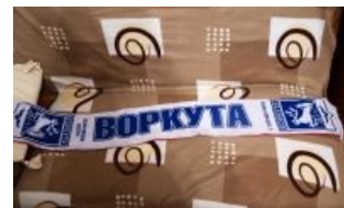
Сувенир для настоящих фанатов

Впрочем, не так давно мэр Воркуты продал права на проведение этого сабантуя, и не кому-нибудь, а все тем же сыктывкарским сельчанам, страдающим от недостойного комплекса. Гешефт можно считать положительным: наконец-то все колхозники Севера России смогут собраться в одном месте, и, выстроившись в ряд, вдоволь помахать флажками .