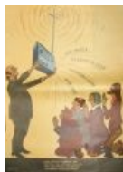
Сравнение слушателей с сектантами