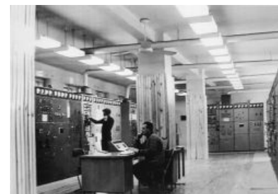
Эти люди глушили иновещание в Вильнюсе

Вражеские голоса (западные радиоголоса, иновещание, иностранное радиовещание на территорию СССР) — метод идеологического давления стран загнивающего капитализма на нашу Советскую Родину , символ холодной войны наряду с Берлинской стеной , гонкой вооружений, противостоянием НАТО и Варшавского блока. Сыграл не последнюю роль в крушении Страны Советов, разлагая умы ее граждан (особенно — молодежь) с 1946 года ( на самом деле , вещание началось еще до ВМВ , но об этом ниже).