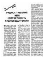
Советский срыв покровов (часть 1)