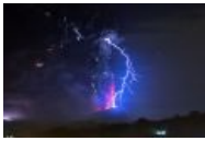
Типичная вулканическая молния