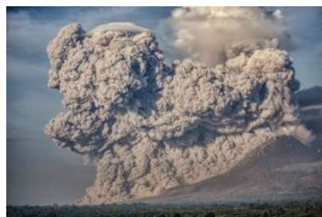
Если видите это за окном — вам пиздец

Няшные и кавайные недовулканы мы рассматривать не будем, а перейдем сразу к тем, чья главная задача — убить всех человекoв . Давление в магматической камере под вулканом нарастает скачками, так что перед самым извержением может случиться неслабое землетрясение. И хотя подвижка земной коры может перераспределить магматические массы и пар уйдет в гудок, отсрочка все равно невелика. И вот в один прекрасный день ты проснешься от леденящего душу грохота, сопровождаемого самовольной прогулкой мебели по жилищу. Смотрим на вулкан, а из его вершины уже поднялась в стратосферу неебическая туча легкого пепла и газов. Земля нехорошо подрагивает, с неба падает черный снежок, и все это происходит в крошечной тьме, разрываемой зарницами молний. Первое и единственное, что нужно делать, это делать ноги. Единожды начав, вулкан не успокоится, пока не применит весь свой могучий арсенал: