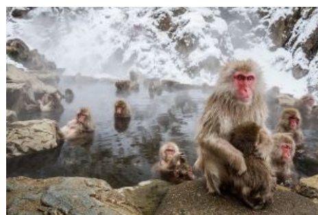
Японские макаки релаксируют