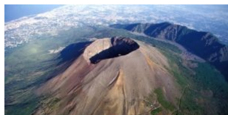
Везувий выжидает. Гряда