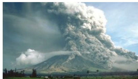
Филиппинский Майон. 1000 лет непрерывного баттхерта

успевают съебаться, вулканологи, наоборот, подобраться поближе, все пучком. Другое дело, если период вулканической деятельности чередуется периодами покоя. Вулкан в таком периоде именуется спящим . Он не потух, а просто израсходовал всю ману. Спящий вулкан все также работает генератором землетрясений и бойлером для многочисленных геотермальных источников. Самое первое предупреждение о том, что вулкан просыпается — он начинает «куриться». То есть вейпить газами и мелким пеплом. Причем пыхать так он может десятилетиями, дожидаясь, пока человечки вокруг успокоятся и снова подойдут поближе. И тогда оно ёбнет!