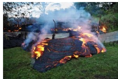
Анальное огораживание не поможет

Еще один постоянный спутник извержения. Углекислота, угарный газ, сера, хлор, сероводород, фтористый водород, простой водород, метан — таков весьма неполный список химии, которую вулкан генерирует в своих недрах. Вся она зверски вредна, отравляюща, а порою еще и радиоактивна, если где-то внизу плюм прихватил месторождение тяжелых элементов. Газы можно считать