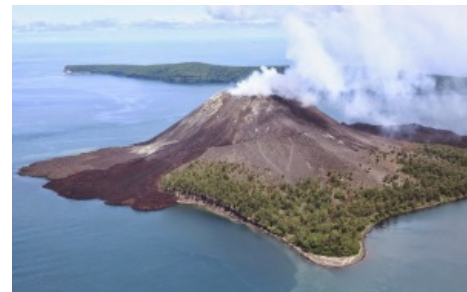
Мирно пыхтит на фоне океана

прихватил за компанию. В процессе бургурга распидорасил сам себя, но недавно опять поднялся со дна морского и останавливаться не собирается. Мощность извержения составила более 200 мегатонн — в четыре раза мощнее, чем Кузькина мать! [1] Ударная волна обогнула планету шесть раз, а звук взрыва оказался самым громким звуком, когда-либо зафиксированным в истории наблюдений. Умножил на ноль более 30 тысяч человек и полторы сотни городов. После извержения еще в течение нескольких лет можно было любоваться на необычную окраску рассветов и закатов.