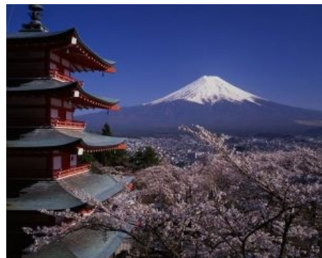
На фоне Джапани

Лунный вулкан, расположившийся недалеко от Токио. А что вы хотели: вся Япония — это край литосферной плиты, поднявшийся достаточно высоко, чтобы на нем завелись человеки. Является действующим вулканом, но коптит пока мирно. Джапы вообще приноровились жить в условиях постоянных землетрясений и цунами... wait... OH SHI! Ну, в общем, пока мирно коптит, ага. Впрочем, за следующую серию One Piece переживать не стоит: его все равно рисуют в Корее .