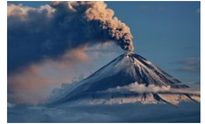
Конический вулкан в атмосфере

Регулярно действующие вулканы уже не слишком пугают: пиплы