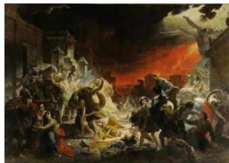
«Последний день Помпеи» — куда уж без неё!