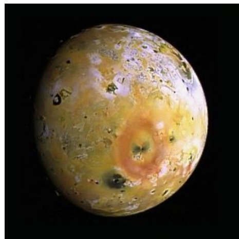
Ио — та еще горячая штучка

Земля, конечно, совсем не уникальна в своей вулканической активности. Более того, она постеснялась бы заявлять о себе, ибо в космосе вулканы — это вообще обычное дело. Помимо Марса вулканы имеются и на Венере , причем они, скорее всего, активные. Но лучше всего поглядеть на Юпитер, а точнее, на его ближайший крупный спутник — Ио. Эту детку Юпитер трахает своей гравитацией уже пару миллиардов лет, и она без передышки кончает раскаленной лавой в его ближайшее пространство, да так, что вокруг газового гиганта уже образовалось целое кольцо, состоящее из выбросов Ио. На этом спутнике находятся мощнейшие вулканы в Солнечной системе, и газовый хвост от них простирается на миллионы километров от батьки-Юпитера. Вулканы есть на спутниках Сатурна, Урана и Нептуна. Черт, даже вшивый, разжалованный в карланы Плутон — и тот обзавелся. Правда, то криовулканы, и извергают они метановый лед. Но все-таки извергают! А дальше... а дальше вулканы будут на любой планете с тектонической активностью. Более того, вулканы могут быть свидетельством пригодности планеты для жизни, ибо генерируются они внутренним теплом планеты, а значит, у такой планеты может быть жидкое, металлическое ядро и магнитосфера, защищающая поверхность от звездной радиации! Ну, или это планета турианцев . Вдобавок вулканы обогащают поверхность планеты микроэлементами, что на порядок увеличивает возможность появления в этом супчике простейших организмов.