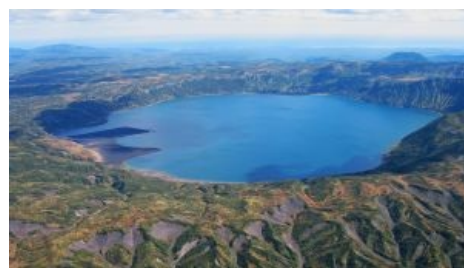
Кальдера вулкана Узон