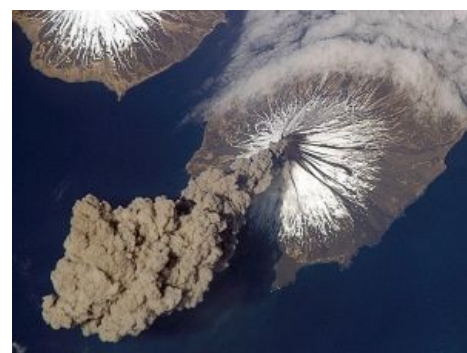
Жопа вашим самолетикам